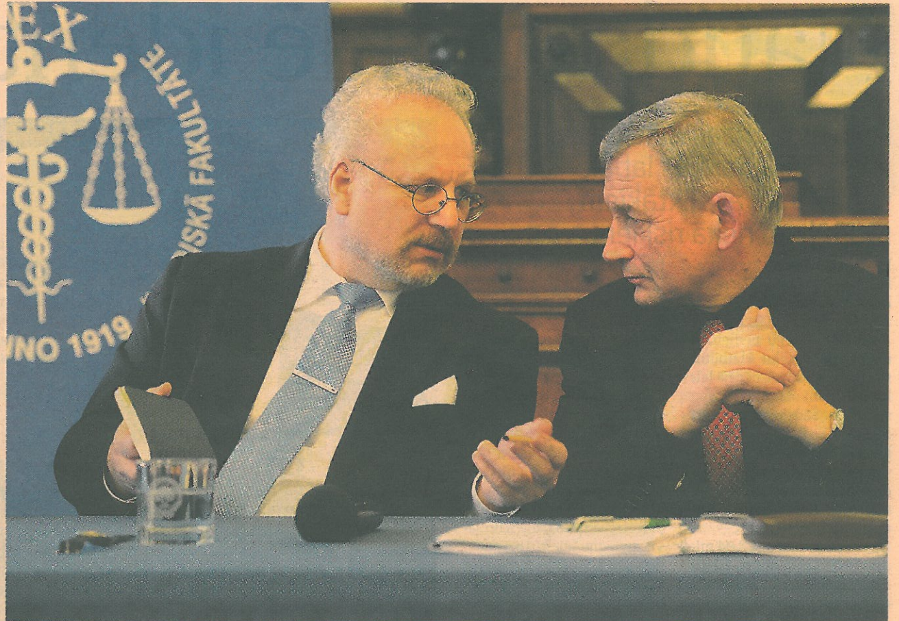
Eiropas Savienības tiesas tiesnesis Egils Levits (no kreisās) atzīst, ka tiesiskās situācijas grozīšana kopējā labuma interesēs atsevišķiem sabiedrības locekļiem var radīt negatīvas sekas un tas pieder pie vispārējā dzīves riska, savukārt Latvijas Zinātņu akadēmijas prezidents Ojārs Spārītis uzskata, ka ar konjunktūras dokumentos ierakstīto notiek verbāla aizsegšanās un tiesiskās paļāvības un drošības vietā tiek tā tiek destabilizēta.