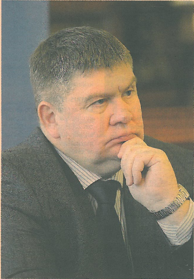
A/s Latvijas Gāze valdes priekšsēdētājs un ekspremjers Aigars Kalvītis: «Es kā uzņēmuma vadītājs nejūtu tiesisko drošību, nemaz nerunājot par tiesisko paļāvību.»