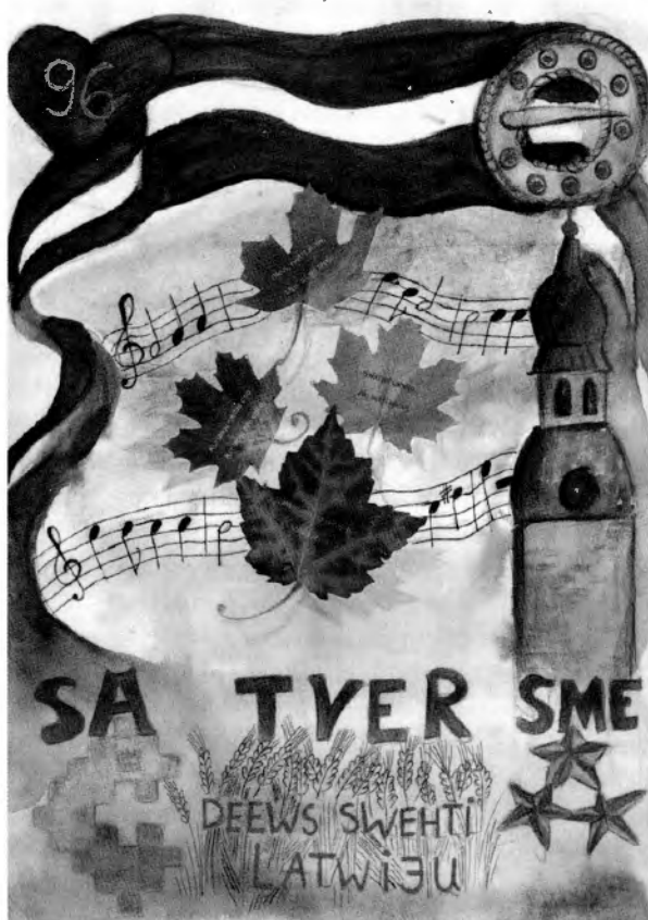
3. vieta – Keita Kondore, Bauskas sākumskola